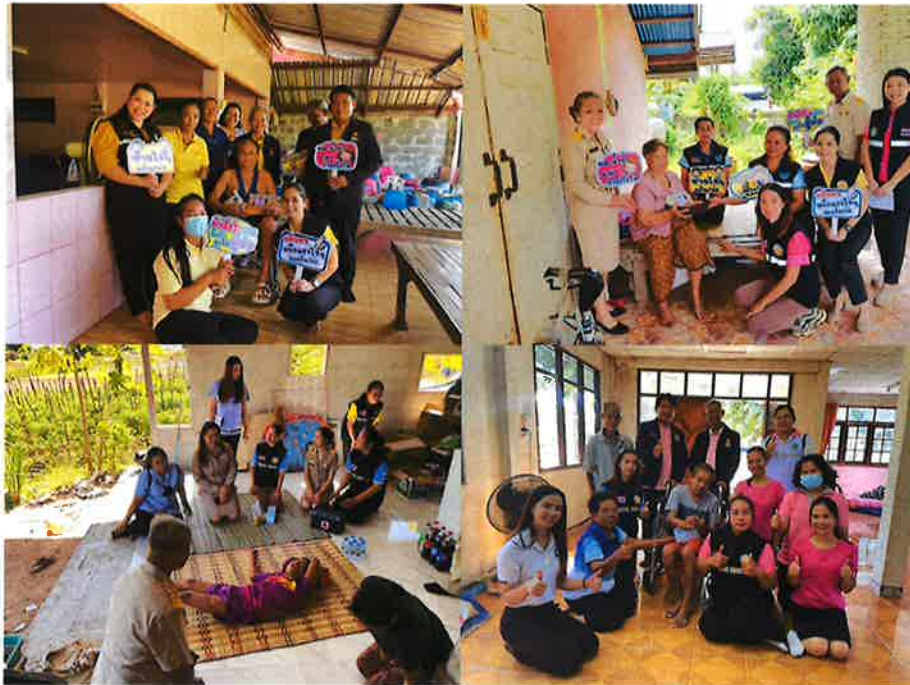
- โครงการพระราชดำริด้านสาธารณสุข หมู่ที่ ๑ บ้านน้ำก่ากลาง