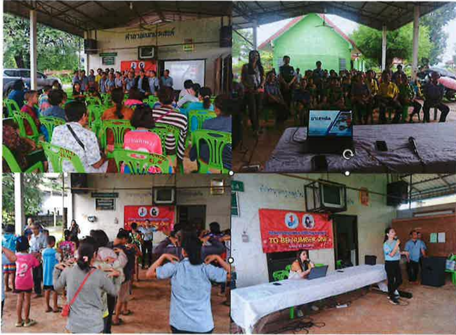
- โครงการพระราชดำริด้านสาธารณสุข หมู่ที่ ๕ บ้านนาคำ